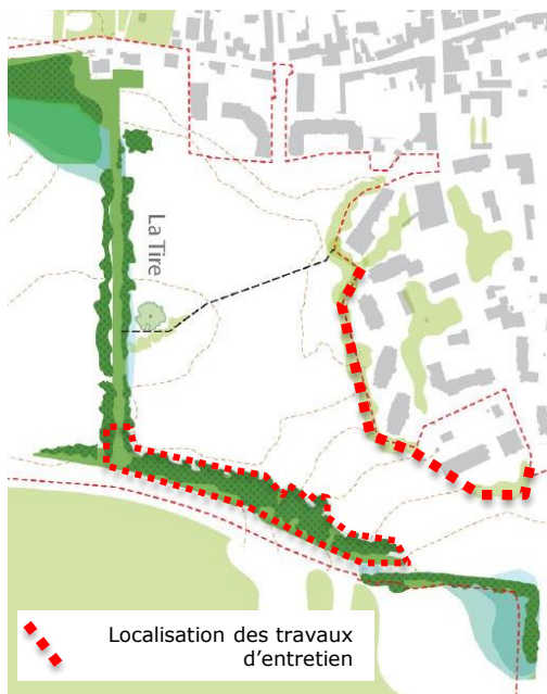
Plan de l'existant du secteur de Paimboeuf

Les deux figures ci-dessus sont des schémas de principe, qui seront affinés en phase étude.